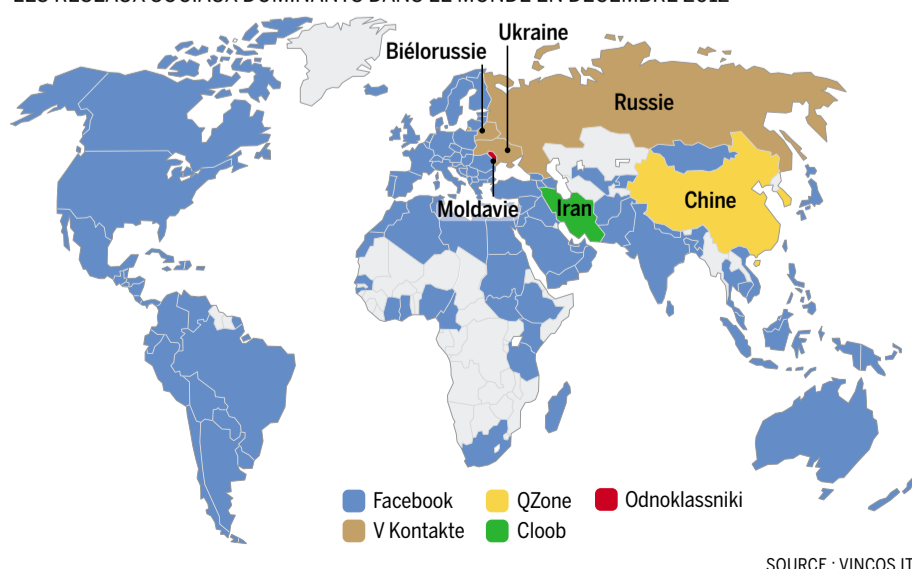
LES RÉSEAUX SOCIAUX DOMINANTS DANS LE MONDE EN DÉCEMBRE 2012